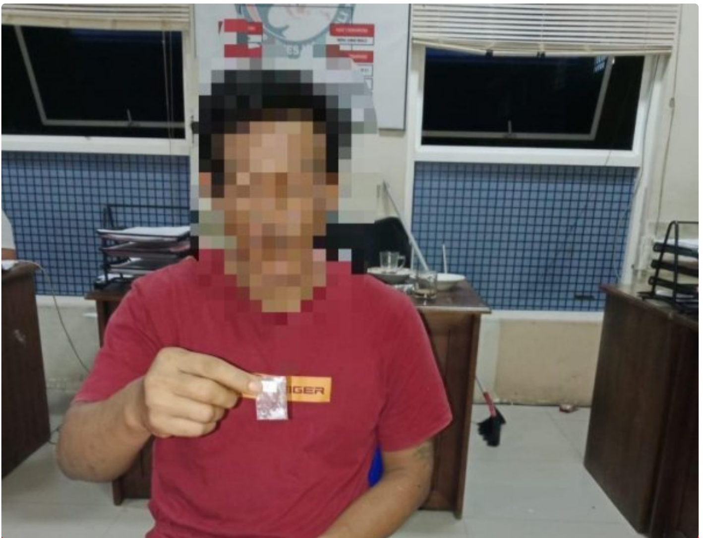
Pelaku terlibat Sabu terancam penjara seumur hidup

Morowali, 15 Januari 2025 – Polres Morowali berhasil mengungkap